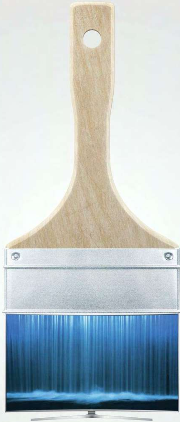
IMAGEN OPCION B