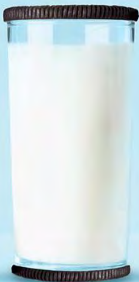
IMAGEN OPCIÓN B